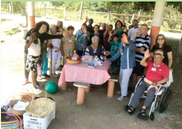
Piquenique no Parque Ecológico Municipal de Itaquaquecetuba

No dia 1º de outubro, houve a comemoração do Dia Internacional do Idoso. No dia 2, ocorreu o passeio para a Praia de Guaratuba, em Bertioga, proporcionando a oportunidade de um banho de mar. No dia 4, houve o piquenique no Parque Ecológico de Itaquaquecetuba. Os voluntários do Santander serviram um delicioso café da tarde no dia 4. No dia 5, o Grupo de Amigos serviu um café da tarde, além de conversar com os acolhidos. No dia 6, ocorreu a comemoração dos aniversários do mês, com a presença dos