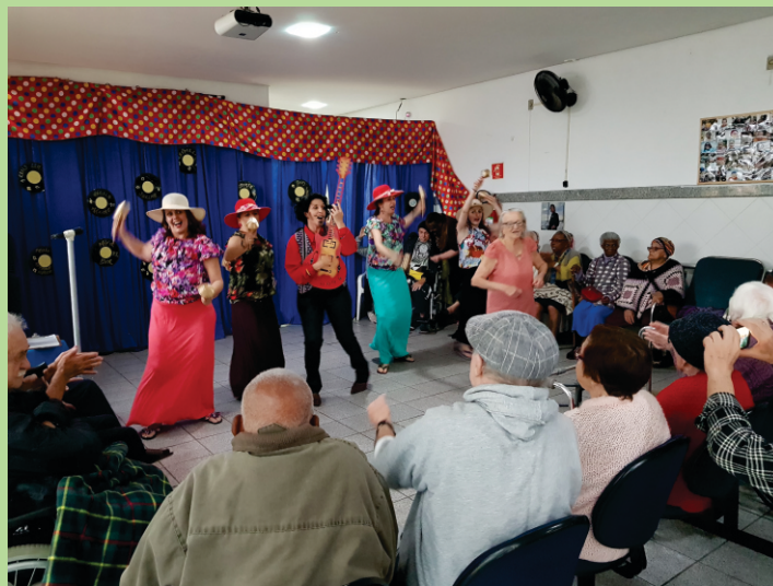
Evento Jovem Guarda

No dia 4, recebemos a bela apresentação de dança étnica do Grupo Mira la Gitana.